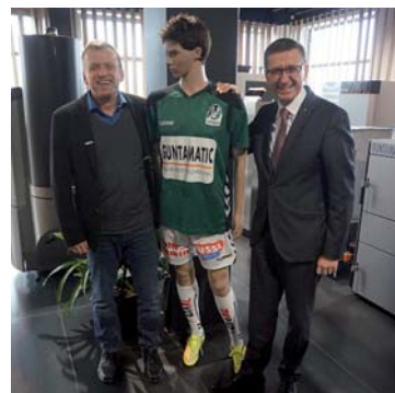
Die Firma Guntamatic ist Namenssponsor der SV Ried