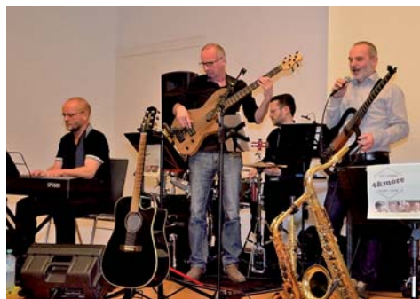
Die Band „4&more“ sorgt für Feierabendmusik

Dieses Thema ist am Samstag, dem 8. Februar 2020 ab 20:00 Uhr das si-