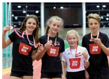
Das U14 Team