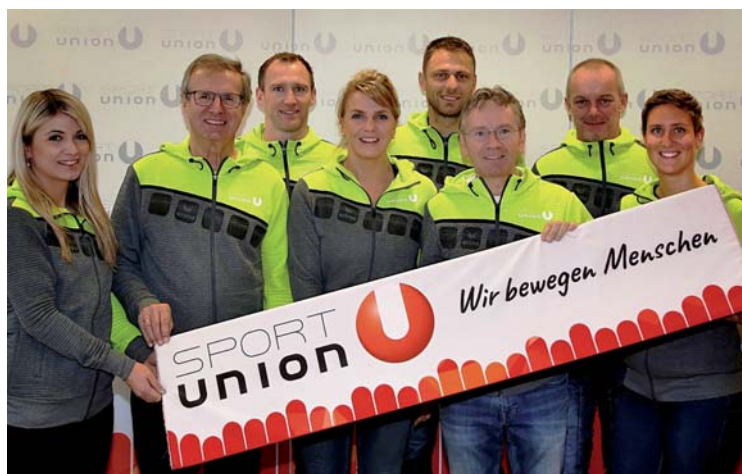
Das Team der Sportunion OÖ bewegt Menschen jeden Alters

Zu den Aktiven kommen noch unzählige Trainer, Betreuer und andere Begleitpersonen aus dem In- und Ausland. Für die Gemüse-region Eferding, aber auch für die umliegenden Gebiete ein wahrer (touristischer) Segen, denn die Sportler und die zahlreichen Trainer/innen und Betreuer/innen bleiben meist über mehrere Tage in der Region. Wenn jetzt auch noch das geplante Bauvorhaben