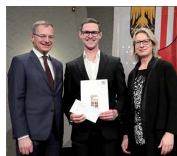
Landeshauptmann Thomas Stelzer fand im Redoutensaal in Linz statt.